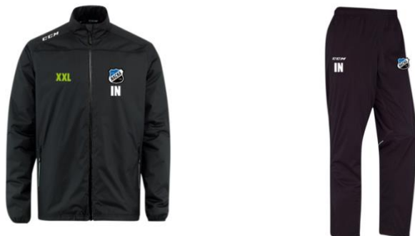
CCM HD JACKET & PANTS