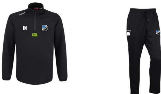
CCM LOCKER ROOM TOP & PANTS